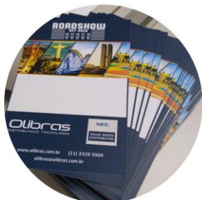
CRACHÁS DE IDENTIFICAÇÃO