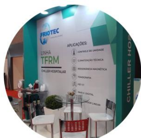
MONTAGEM DE ESTANDES