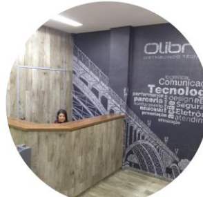
PERSONALIZAÇÃO DE AMBIENTES