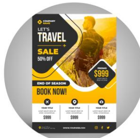
FOLDERS E FLYERS