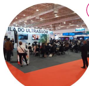
FEIRAS E EVENTOS